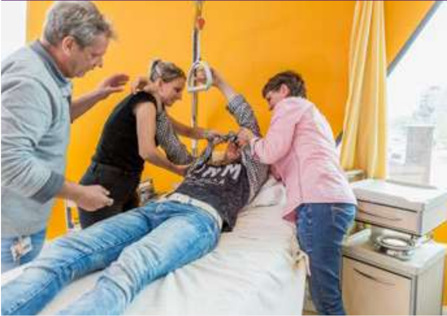
Werkzoekenden uit andere sectoren laten zich omscholen naar zorgberoepen, zoals hier bij ROC Nijmegen